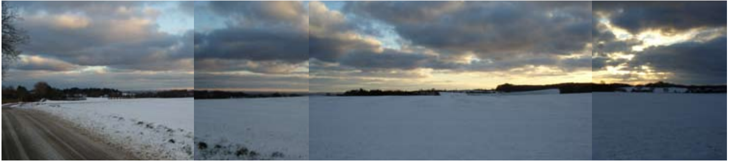
Udsigt over vinterlandskab i december måned - her er flere billeder sat sammen