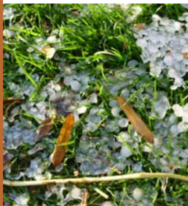
Haglvej i oktober - lagde sig flot i græsset.

Stokkebjergvej 1 - Hølkerup 4500 Nykøbing Sjælland telefon 59 32 87 60 mobil 24 24 57 67 mereteduejohnsen@gmail.com www.odsherredterapihave.dk